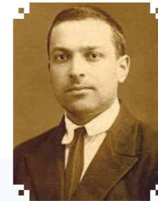
Лев Семенович Выготский (17 ноября 1896 – 11 июня 1934)

"Необходимо именно выдвигать на первый план моменты психологического развития ребенка, признать ведущую роль в развитии ребенка за развитием его социального поведения, его личности..." Л.С. Выготский