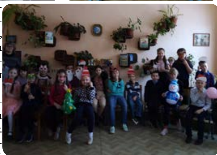
Объединение «Экология души»

провели новогодние каникулы, весело и дружно.