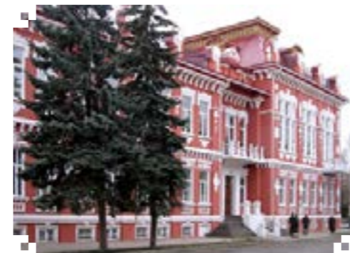
Управление социальной защиты