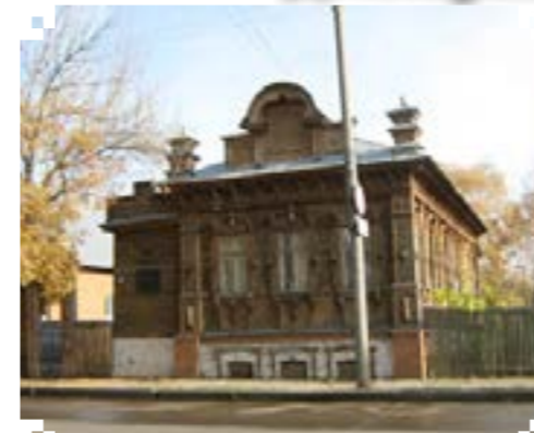
Усадьба купца Кузнецова (Дом Гайдара)