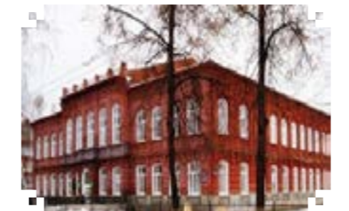
Башкирский республиканский техникум культуры